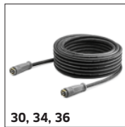
30, 34, 36